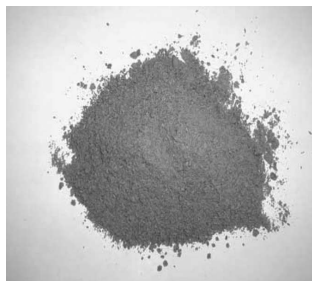
Φωτογραφία αριθ. 2